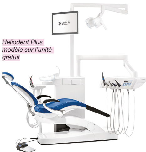
Heliodent Plus modèle sur l'unité gratuit