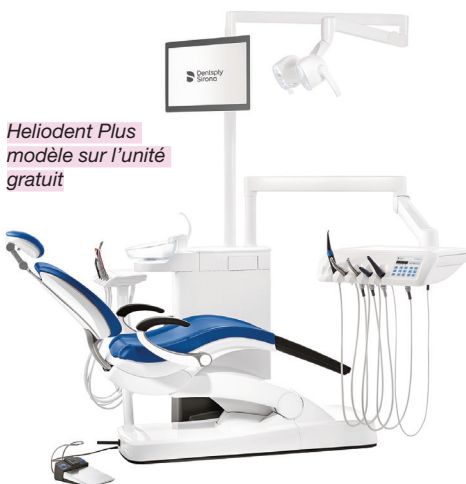
Heliodent Plus modèle sur l'unité gratuit